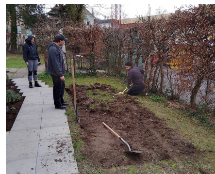
...das Gemüsebeet entsteht