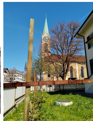
Brombeeren und Himbeeren