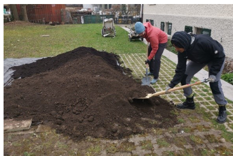
1t Erde und 650kg Kompost