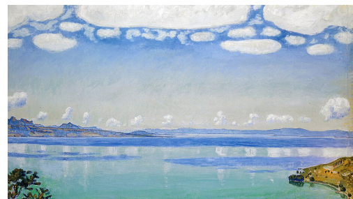
Ferdinand Hodler: Der Genfer See von Chexbres aus

Samstag, 6. Juni um 20 Uhr im Kirchgemeindehaus