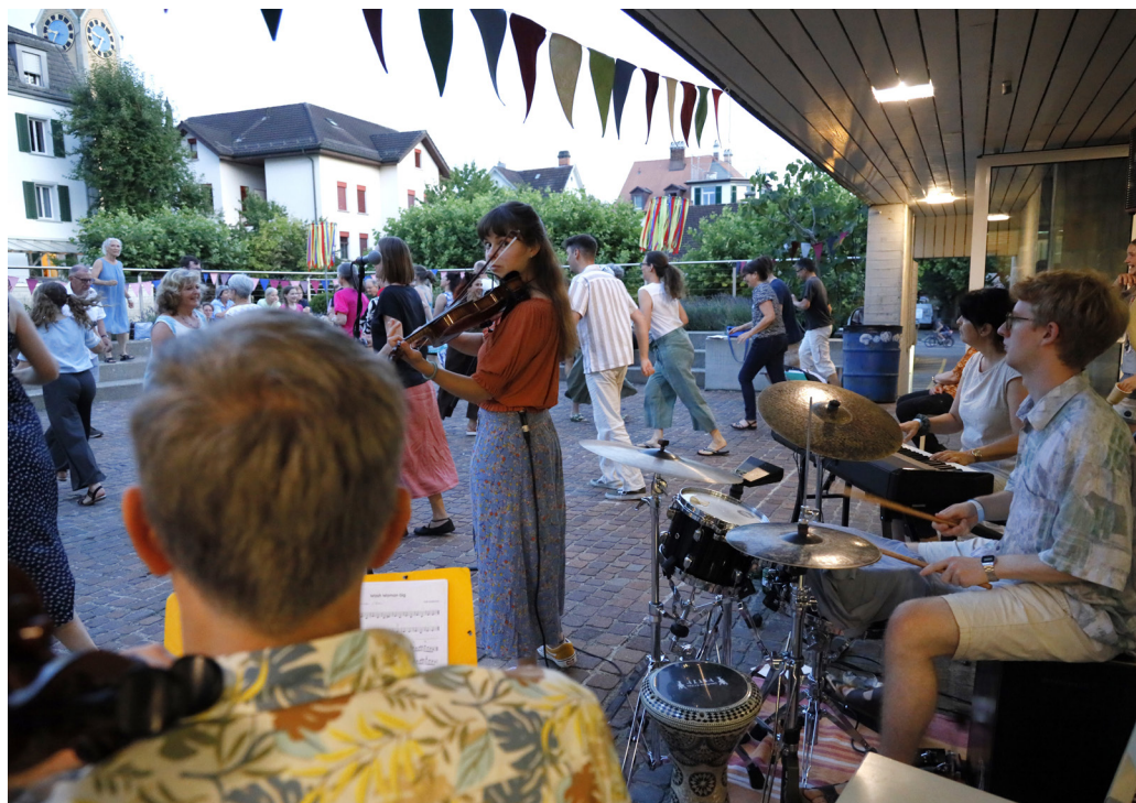
Sommerfest 2025

* 40 Minuten vor Gottesdienstbeginn Cantiamo – Musikalische Einstimmung