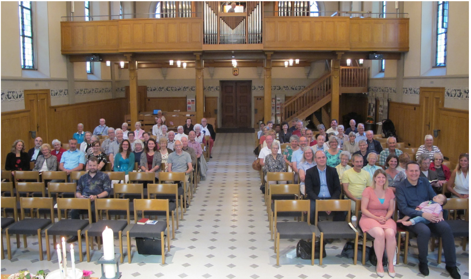
Foto: Peter Bretscher, Gemeindefotografender Gottesdienst mit Besuchern der Kirchgemeinde Mattenbach