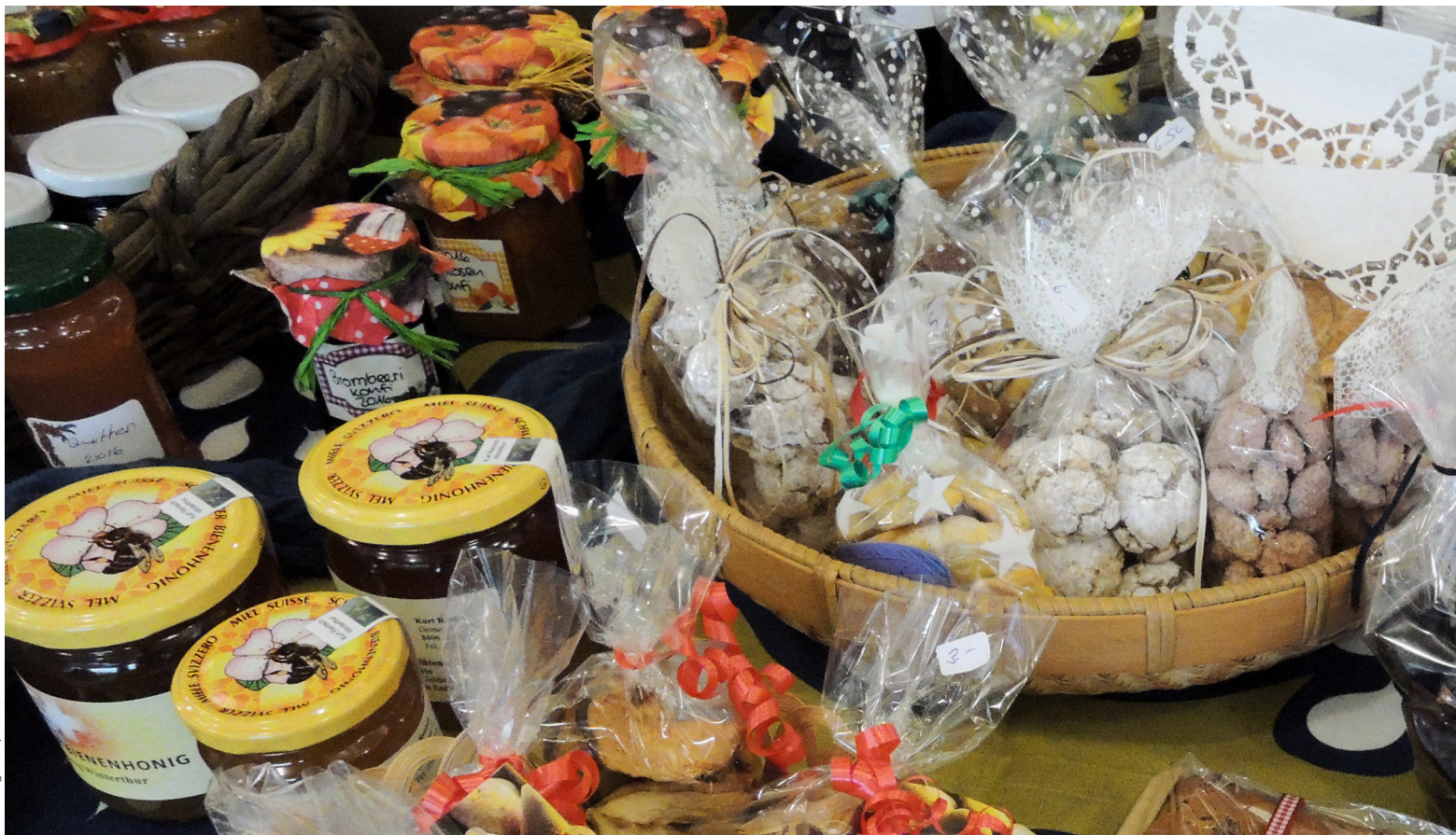
Bazar 2018