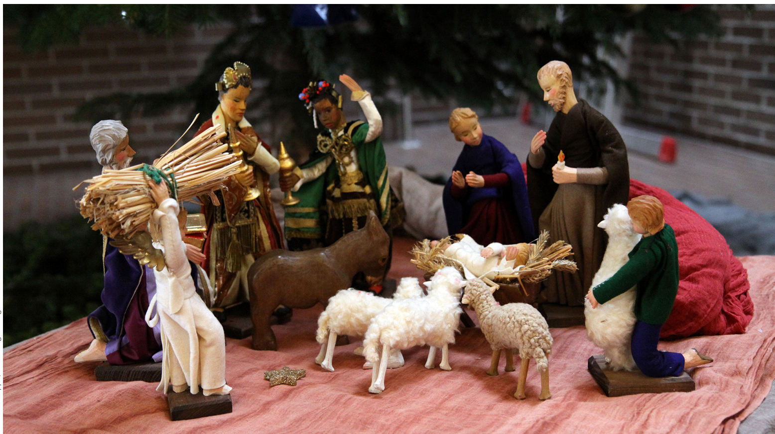
Tössener Krippe, Foto: Helge Fiebig